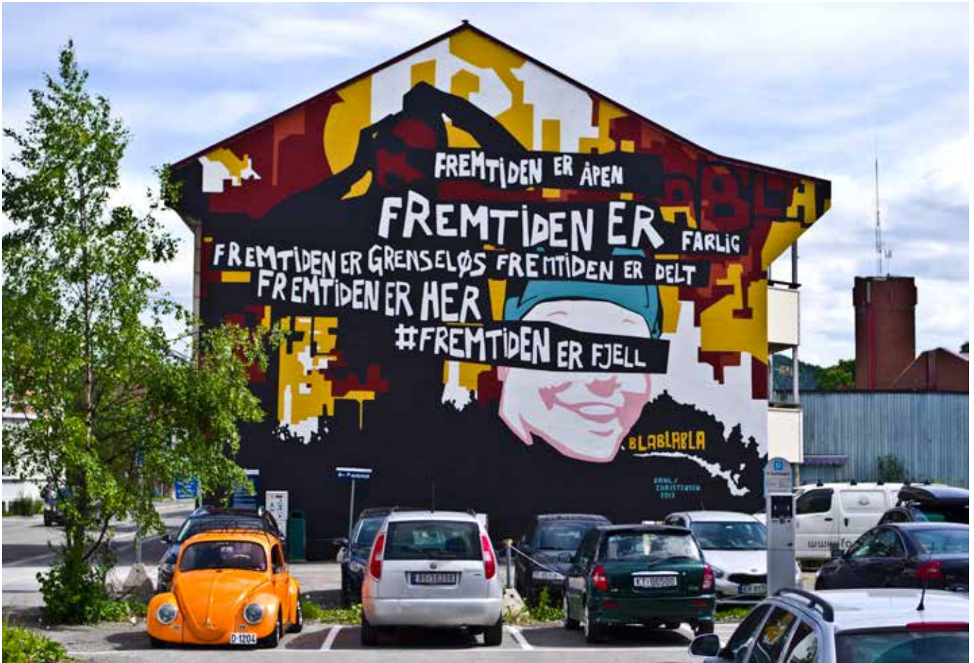
Øverst til venstre: Globusfestivalen, design: Christina Krog. Øverst til høyre: Bizzy.