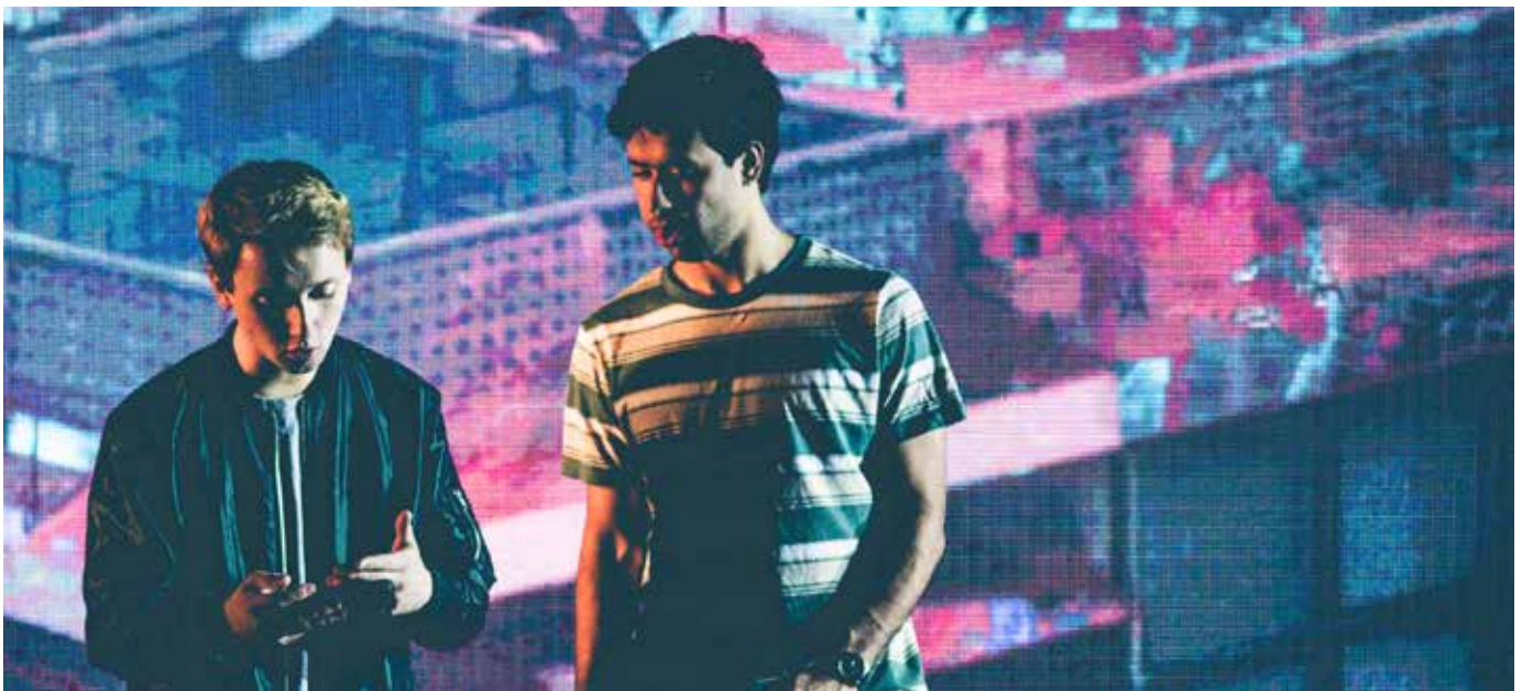
Fra forestillingen "Natives".

Buskerud fylkeskommune skal fortsette sin satsning på Brageteatret som hovedaktør på det profesjonelle feltet innen scenekunst. Det er viktig at Brageteatret opprettholder sin satsning på et bredt teatertilbud til fylkets befolkning. Det må legges til rette for at Brageteatret innehar en sentral rolle i Viken fylkeskommune.