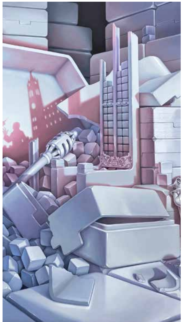
Utsnitt fra oljemaleriet "Tablets II", 2017 av Bjørn Båsen.

I løpet av 2017 og 2018 ble det gjennomført et prosjekt for digitalisering av fylkeshusets kunst. Det er behov for å videreføre dette inn i planperioden og sørge for blant annet tilstandsvurdering på en del av kunsten samt videreføre arbeidet også i eksterne institusjoner.