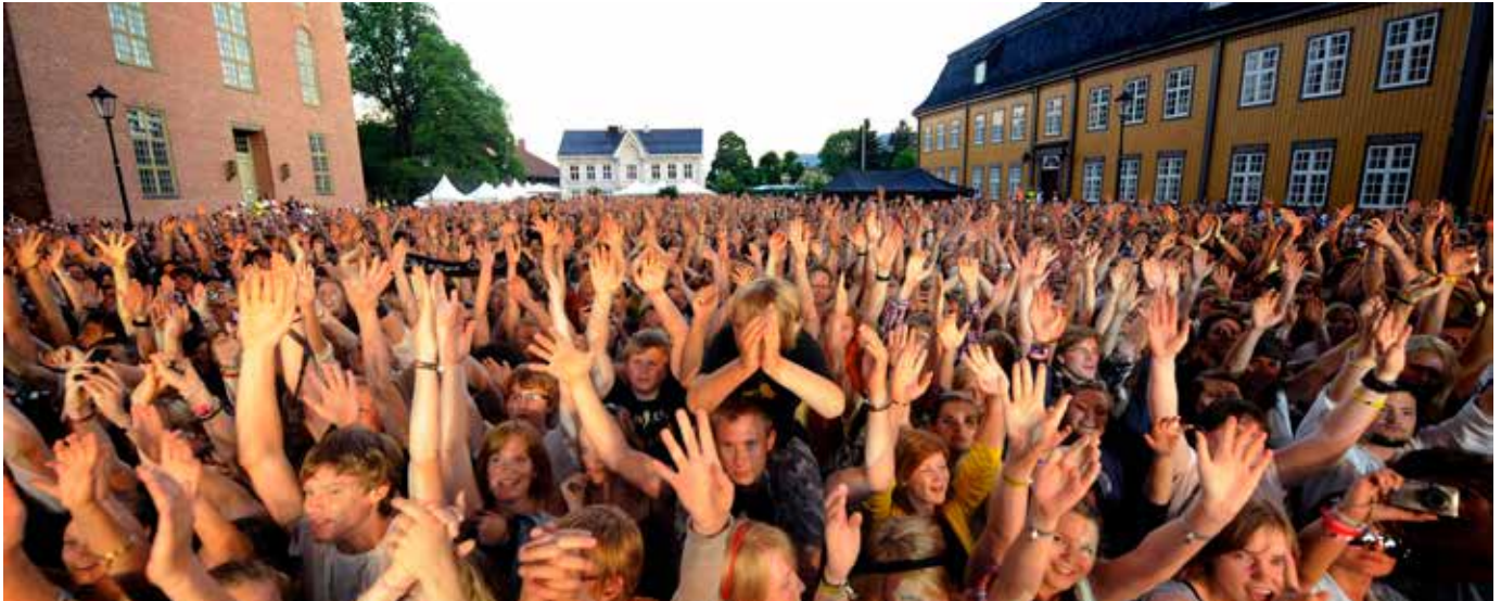
Fra Kongsberg Jazzfestival

Buskerud fylkeskommune tildeler årlig tilskudd til en rekke festivaler i hele fylket. Festivalene har et godt utgangspunkt for å drive arbeid knyttet til kulturelt mangfold, da de i all hovedsak er en form for lavterskeltiltak, som det er lett for brede lag av befolkningen å oppsøke. De sørger også for et viktig supplement til helårsarrangørene rundt om i fylket, som for eksempel kulturhusene, jazzklubber, osv. Tildelingen av festivalstøtte skal prioritere fyrtårnfestivaler og nisjefestivaler, som tiltak som kan bidra til både topp og bredde i Buskeruds kulturliv.